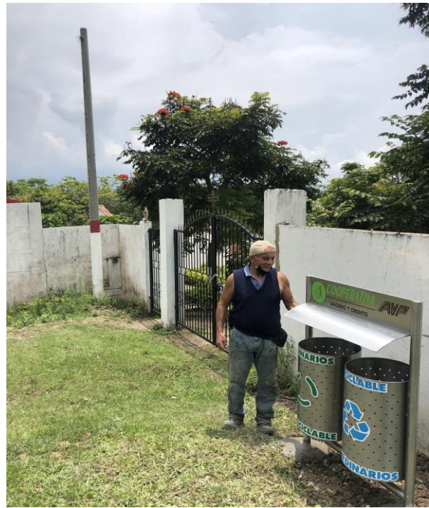
punto ecológico en acceso a cementerio