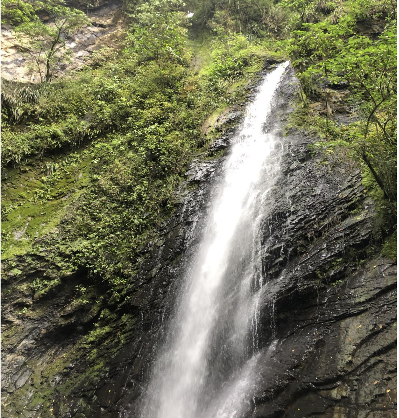
Cascada el Tambo en el Municipio de Tena-2021 año por el cuidado del medio ambiente.