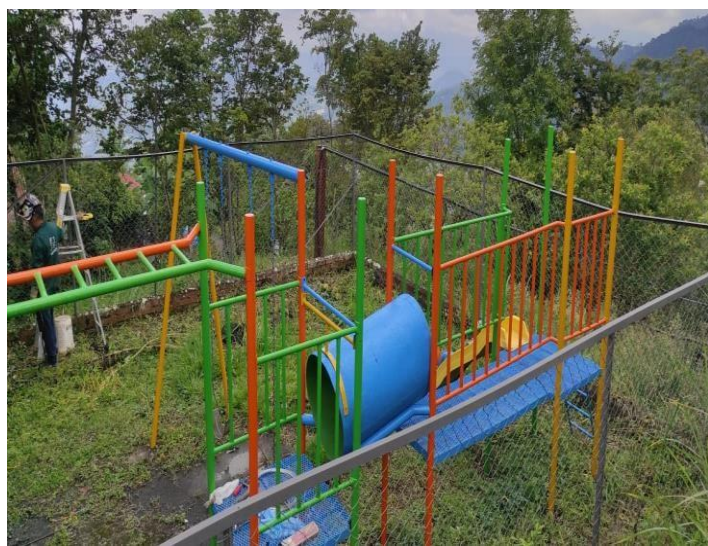
Parque infantil después de intervención.

Como apoyo al municipio de Tena en el inicio de la pandemia se entregó donación en materiales para la pintura del centro de salud de la inspección La Gran Vía, también se hizo una donación de una lavadora para este mismo centro.