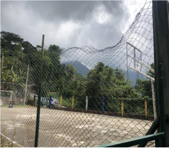
Patio de descanso- antes

En esta escuela dado que reiniciará sus clases en alternancia, se realizó labor de mantenimiento preventivo en esta sede, pintando el parque infantil, dotando de malla para cerramiento, y pintura de su portón de acceso