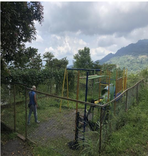
Parque infantil antes