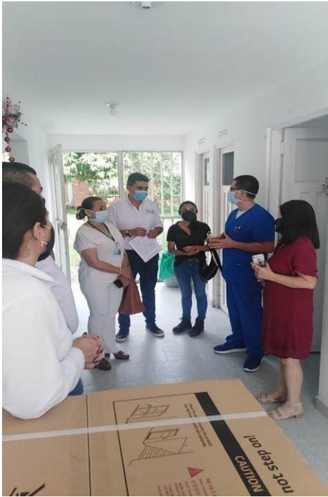
Entrega de la lavadora centro Salud