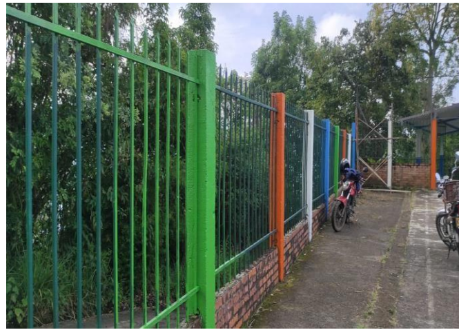
Patio después de la intervención.