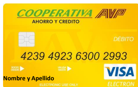
Imagen de la tarjeta débito utilizada actualmente por la cooperativa.

En la presente vigencia se prorrogó este convenio que cubre a las doce (12) entidades que conforman la Corporación TAVA, quien es la que maneja este producto y de la cual, la cooperativa AVP hace la Representación Legal. Se desarrolla el sexto principio Cooperativo: Cooperación entre cooperativas.